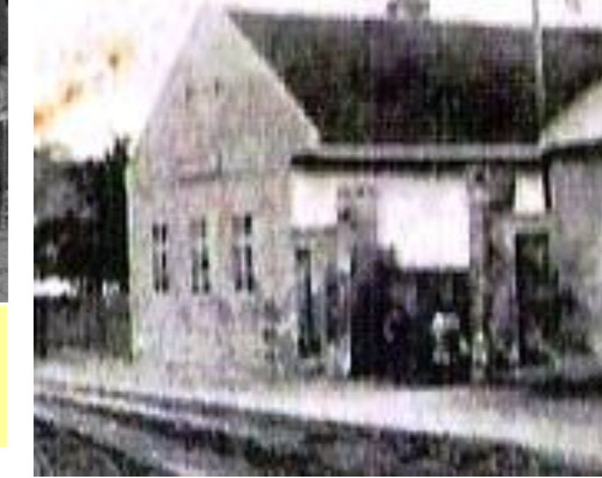
Budova školy na Jánošíkovej ulici, v ktorej sa vyučovali dve triedy.