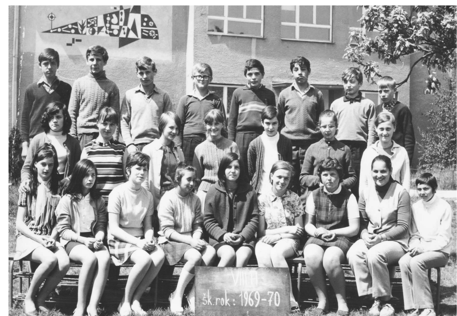
Žiaci VIII. A triedy v školskom roku 1969-1970.