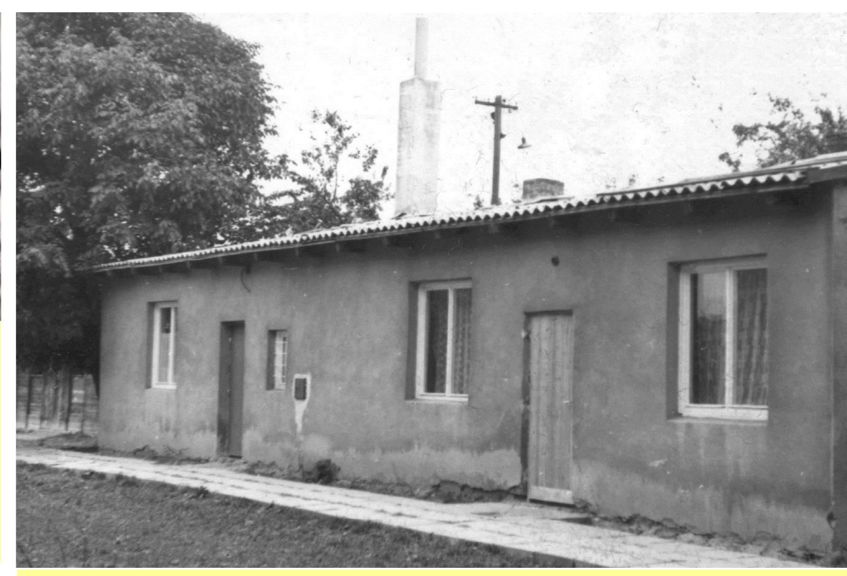
Bývalý sklad stavebného materiálu 18 rokov slúžil ako školská jedáleň.