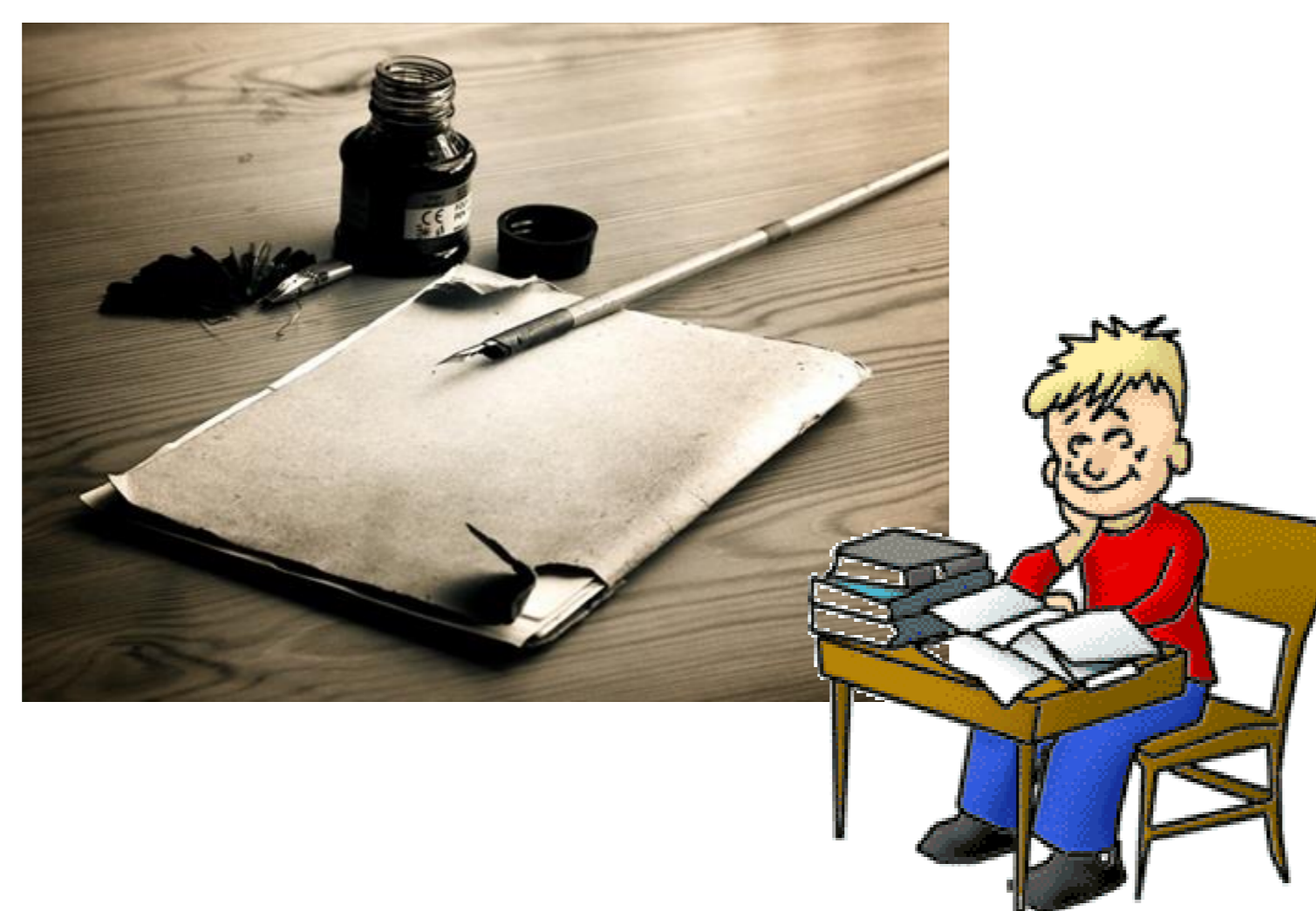
Atrament sa už v školách prestal používať. Občiané perá a plniace perá na atrament vystriedali tzv. bombičkové a guličkové perá.