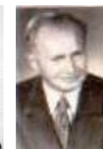
Prvý riaditeľ Osemročnej strednej školy v roku 1953.