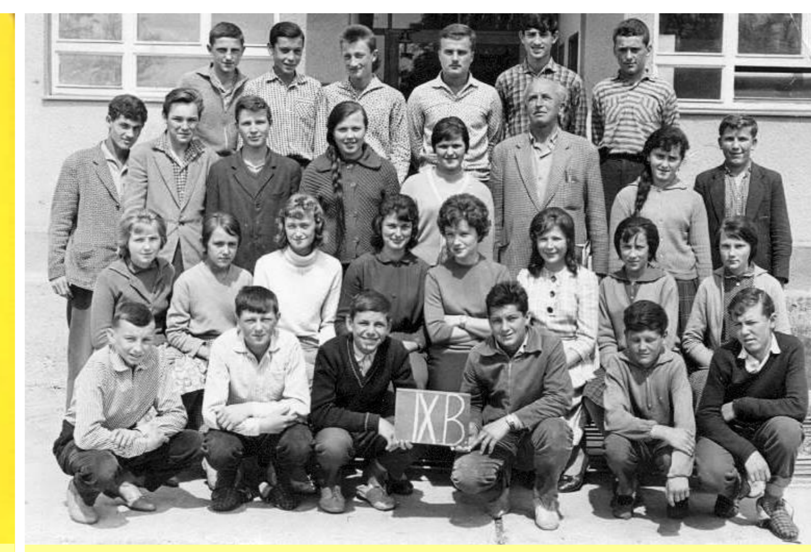
Prví deviatci v novej škole v školskom roku 1962-1963 s riaditeľom školy.