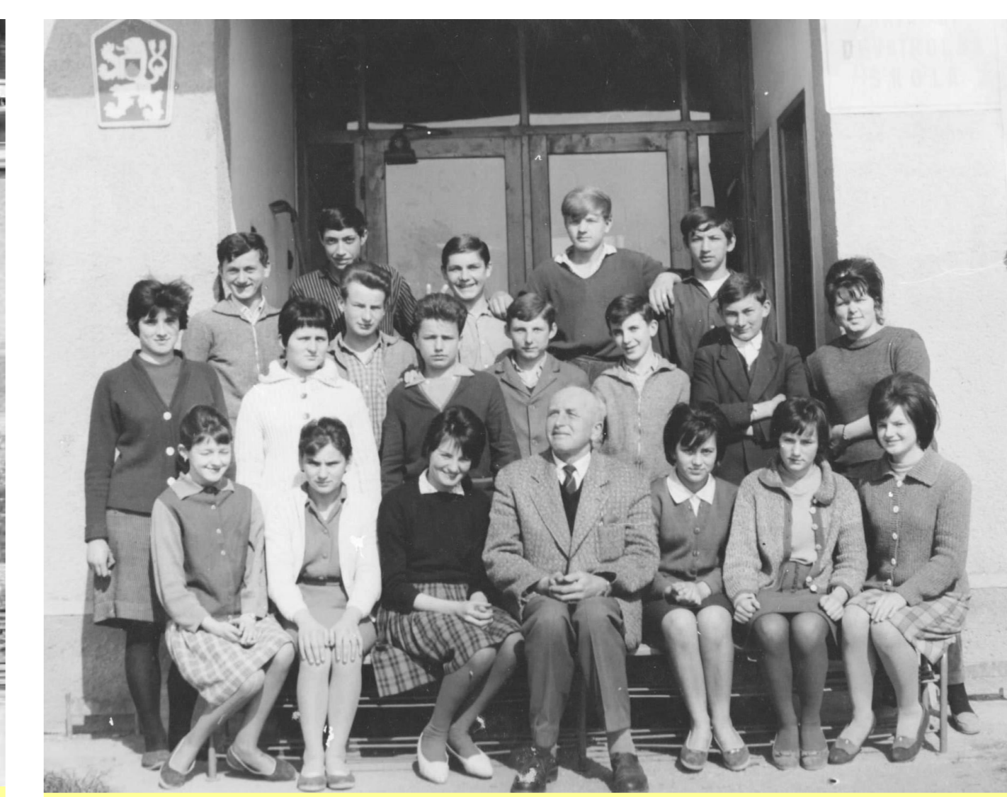
Žiaci IX. triedy v školskom roku 1963-1964 s riaditeľom školy a podpisy žiakov na zadnej strane fotografie.