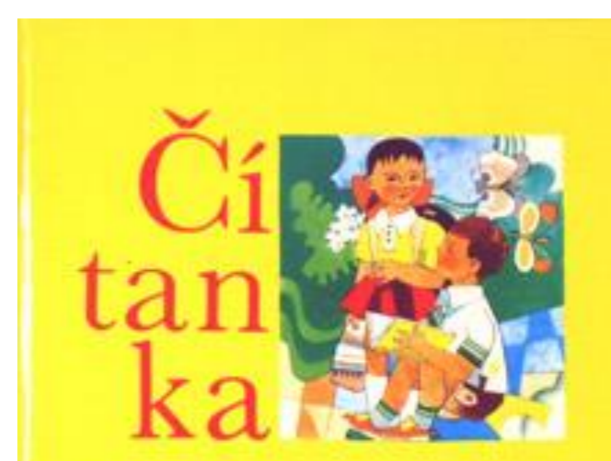
Čítanka bola vydaná v roku 1962 a ilustroval ju významný slovenský maliar F. Hložník.