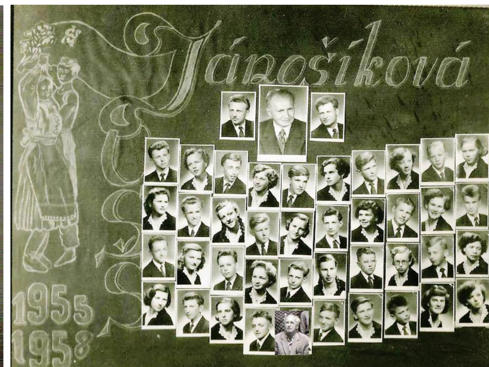
Tablo absolventov VIII. A a VIII. B triedy v školskom roku 1957-1958 s riaditeľom a triednymi učiteľmi, na rube zoznam žiakov a učiteľov.