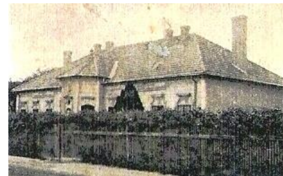
Sídlo Národnej školy v roku 1945, v budove boli len štyri triedy, v roku 1953 pristavali k obom stranám ďalšie dve triedy.