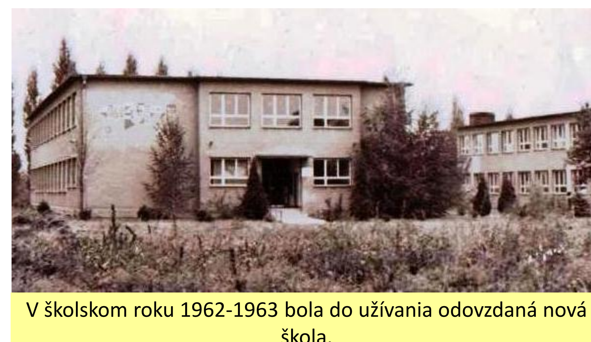
V školskom roku 1962-1963 bola do užívania odovzdaná nová škola.