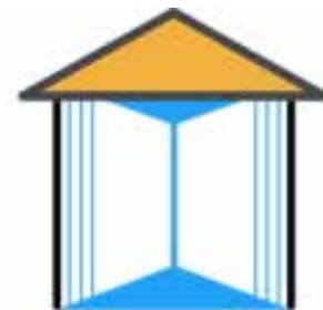
Domovské vzdelávacie centrum

spelých kurzy cudzích jazykov, neobvyčajné večerné stretnutia so zaujímavými témami, spoločné varenie s nádychom Talianskej kuchyne a mnoho iných zmysluplných aktivít, ktoré mali pre nás veľký význam. Dúfam, že sme vás aspoň trochu informovali o našich aktivitách, každodennej práci, ktorá nás baví, a v neposlednom rade skutočne naplňa. Budeme úprimne radi, ak nás prídete potešiť vašou návštevou na Jánošíkovskú 791 v Dunajskej Lužnej. Radi Vás tu privítame.