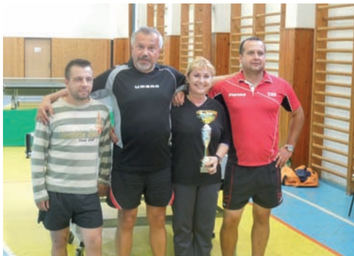
Víťazné družstvo Terchová 1