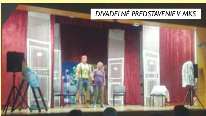
DIVADELNÉ PREDSTAVENIE V MKS