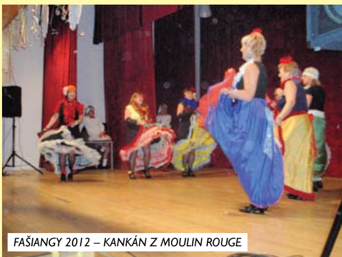
FAŠIANGY 2012 – KANKÁN Z MOULIN ROUGE