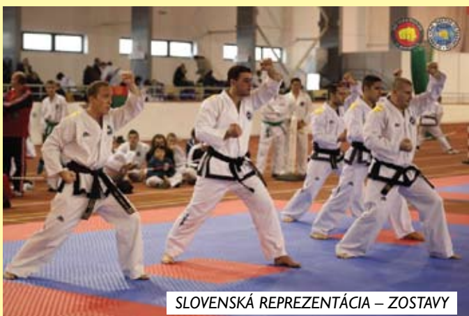
SLOVENSKÁ REPREZENTÁCIA – ZOSTAVY