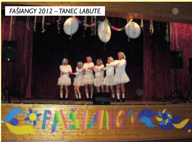
FAŠIANGY 2012 – TANEC LABUTE