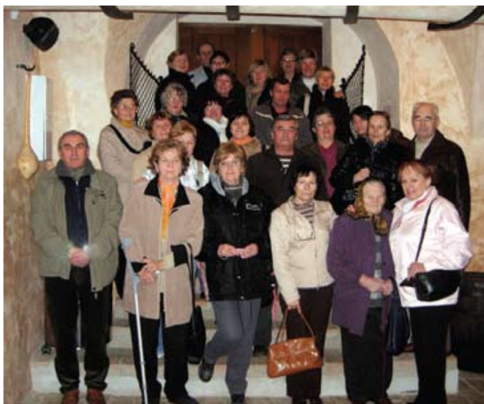
Foto: A. Klčová. Účastníci návštevy Malokarpatského múzea v Pezinku

V Pezinku sme navštívili Malokarpatské múzeum, ktoré je zameraná najmä na vinohradníctvo, vinárstvo a víno. Väčšina z nás bola prekvapená dômyselnosťou našich predkov, ktorú uplatnili pri zostrojovaní výrobných nástrojov tak potrebných pri obrábaní vinohradu a následne pri spracovávaní vínnej révy.