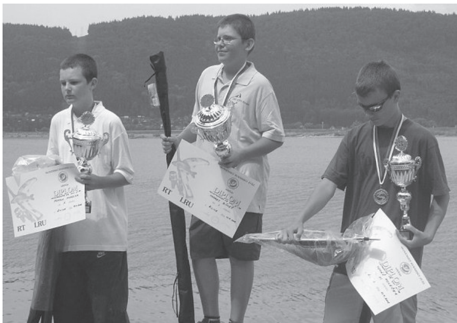
Obrázok zo stupňa víťazov v súťaži mladých rybárov.