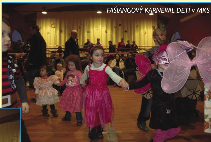
FAŠIANGOVÝ KARNEVAL DETÍ v MKS