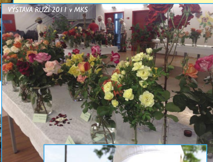
VÝSTAVA RUŽÍ 2011 v MKS