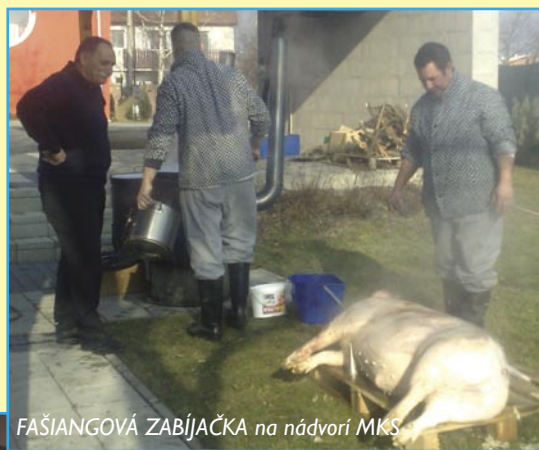
FAŠIANGOVÁ ZABÍJAČKA na nádvorí MKS