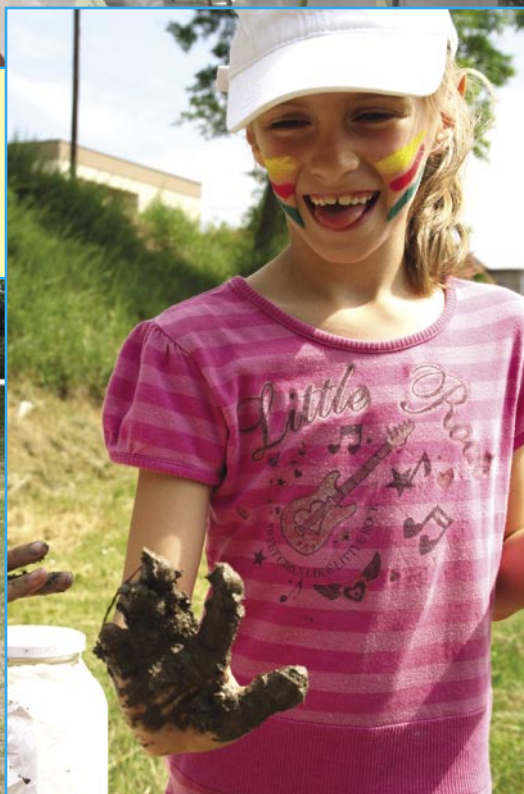
OBECNÝ DEŇ DETÍ na ihrisku JAMA súťaže – zábava – kamaráti