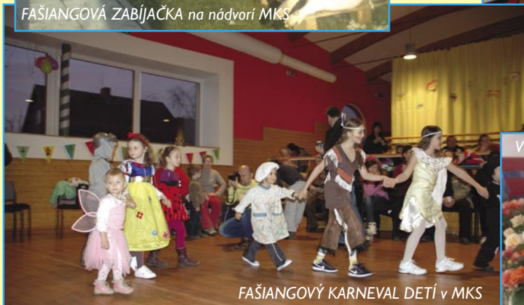
FAŠIANGOVÝ KARNEVAL DETÍ v MKS