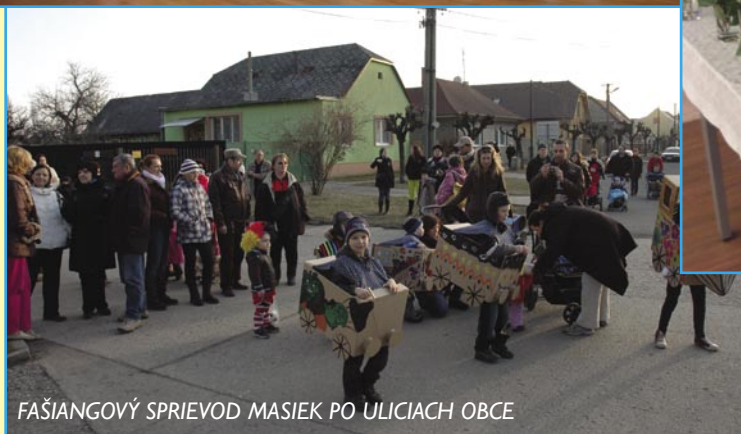
FAŠIANGOVÝ SPRIEVOD MASIEK PO ULICIACH OBCE