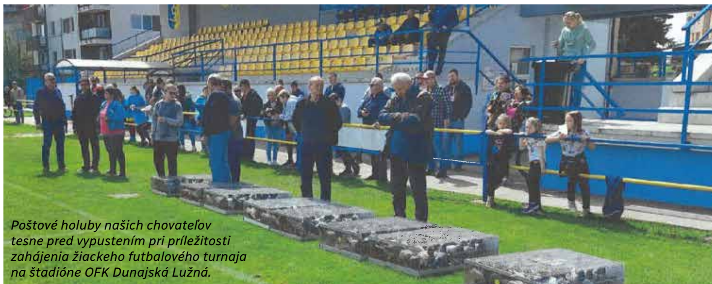
Poštové holuby našich chovateľov tesne pred vypustením pri príležitosti zahájenia žiackeho futbalového turnaja na štadióne OFK Dunajská Lužná.