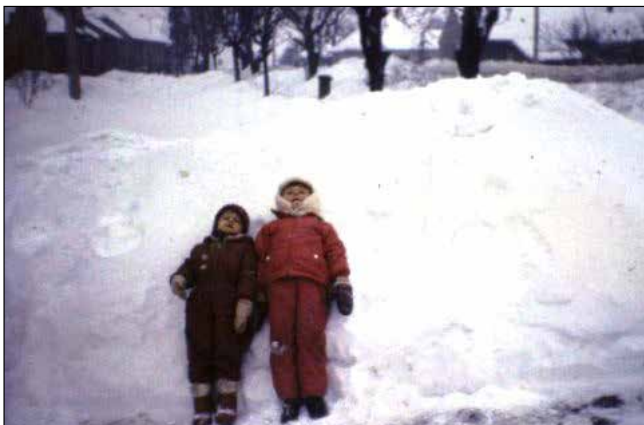
Obr. 9 Volenských deti na záveji pred domom