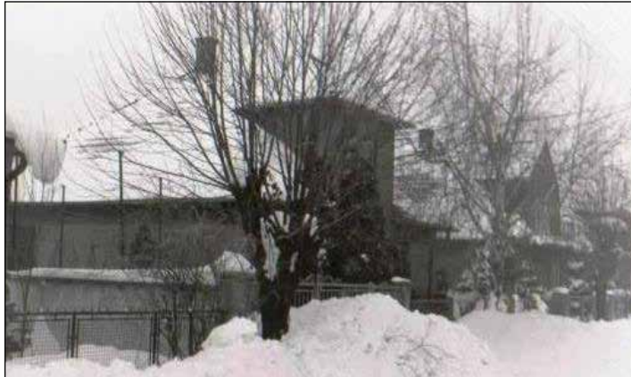
Obr. 2 Veľký závej pred Slávikových domom č.24 na Lipnickej ulici