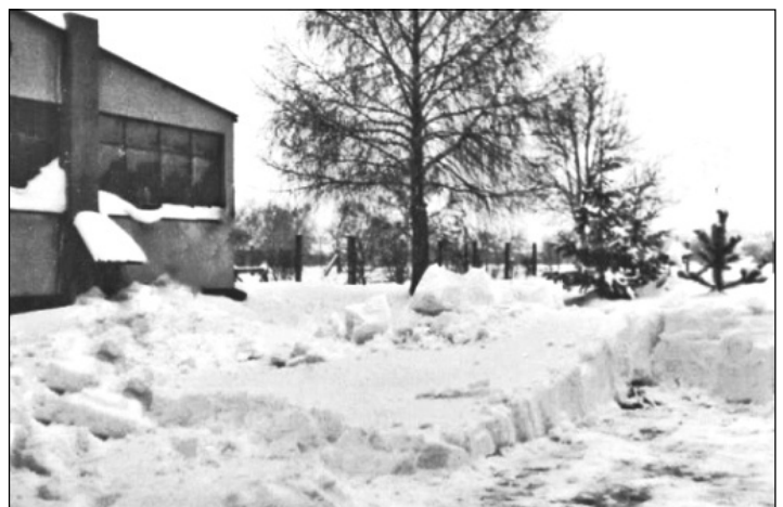
Obr. 5 Zasnežený dvor domu č.35 na Lipnickej ulici