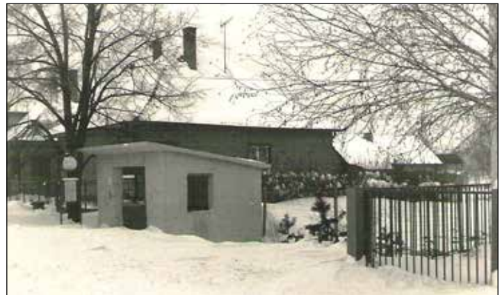
Obr. 1 Zaviata autobusová čakáreň pri dome č.33 na Lipnickej ulici