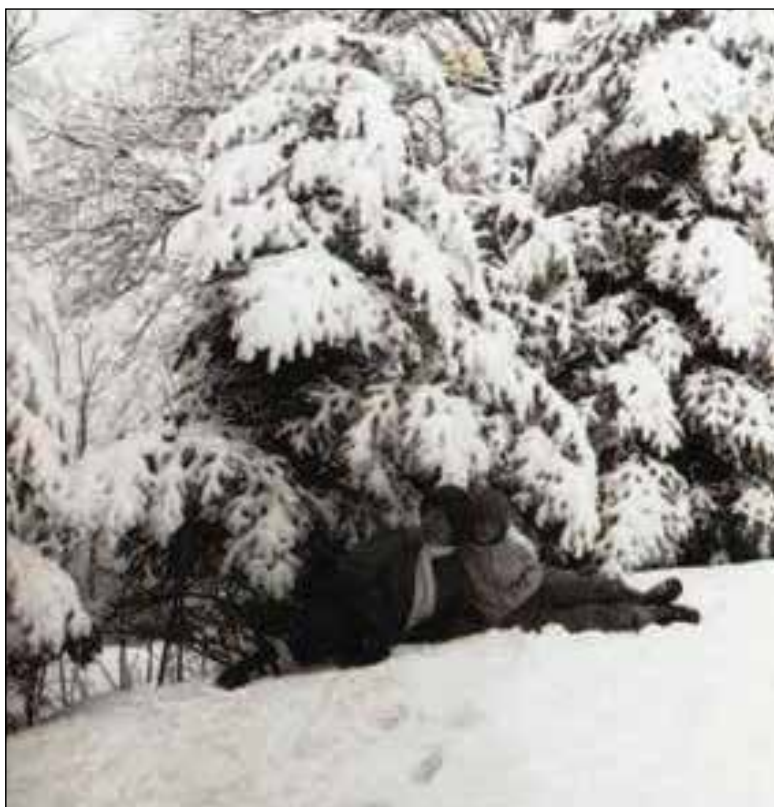
Obr. 12 Gálfiovci pod zasneženými stromami

Pondelok 5.januára 1987 žiaci základných a stredných škôl po zimných prázdninách nastúpili do škôl a celý týždeň prebiehalo vyučovanie. Avšak už koncom týždňa príroda ukázala svoju silu a pondelok 12. januára sa v našej obci iba s vypätím síl dalo dostať do školy. Pán kurič sa už okolo polnoci brodil závejmi, aby školu vykúril. Keďže