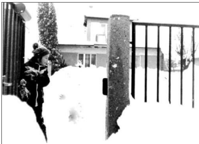
Obr. 6 Na ulicu sa nedá dostať, oproti dom č.26 na Lipnickej ulici