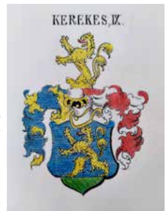
Erb rodiny Kerekes