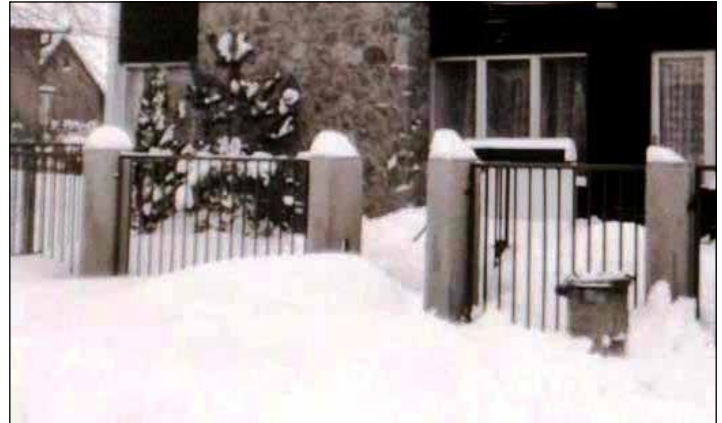
Obr. 3 Zaviaty vchod do domu č.35 na Lipnickej ulici