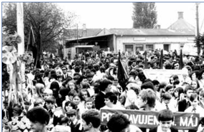
1974, prvomájové oslavy na priestranstve pred budovou predajne