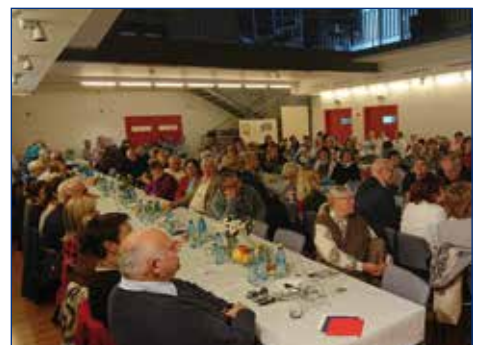
Pohľad na účastníkov stretnutia v MKS