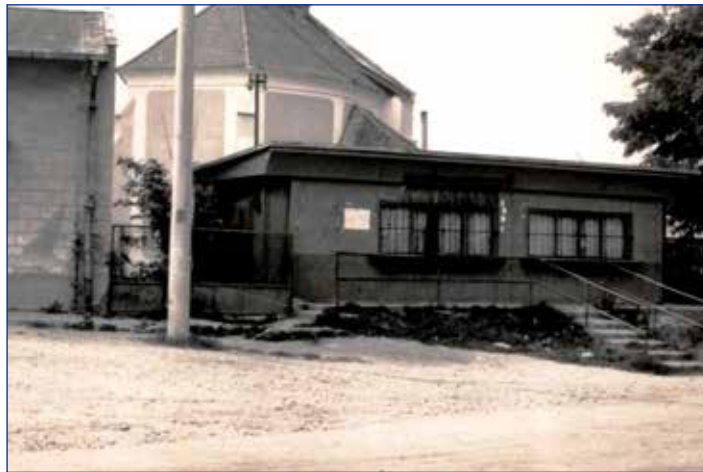
1967, bufet vedľa predajne nahrádzal chýbajúce pohostinstvo v Nových Košariskách