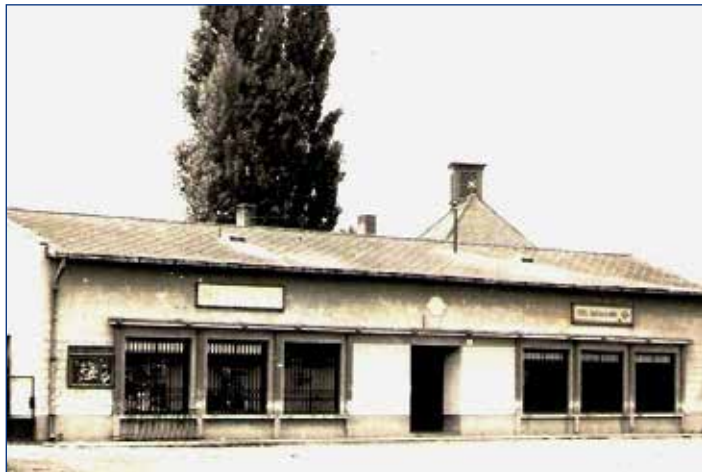
1967, budova predajne rozličného tovaru a textilu