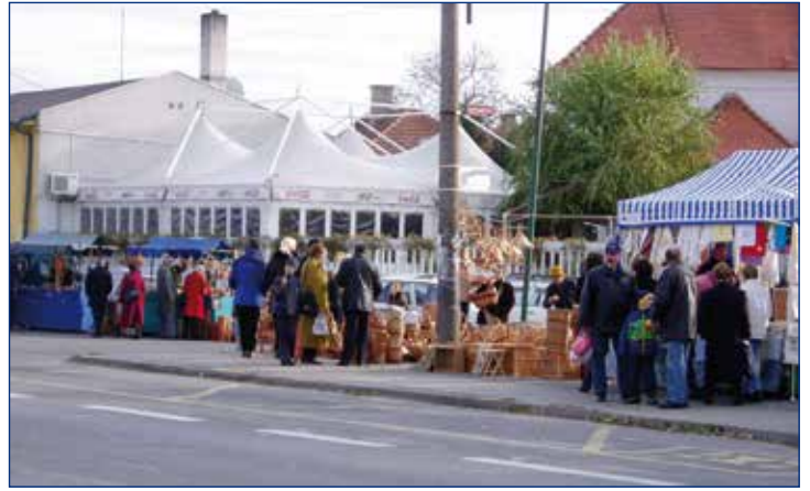
2003, Dunajskolužnianske trhy

Pri príprave príspevku sme s viacerými občanmi zaspomínali na veľmi dobrú predajňu, v ktorej sme dostali všetko potrebné a nemuseli sme za každou drobnosťou cestovať do mesta. A takáto predajňa s rozličným tovarom nám v obci rozhodne chýba. Zo zamestnancov oboch predajní sa vytvoril súdržný kolektív, ktorý sa aj po rokoch stretáva a organizuje spoločné posedenie.