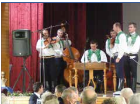
Cimbalová muzika zo Strážnice