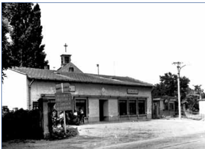
1960, budova predajne s priľahlým námestím