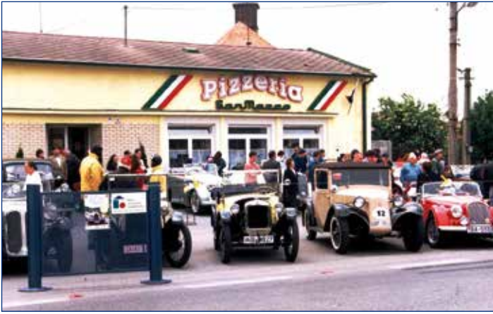
1997, prehliadka historických vozidiel