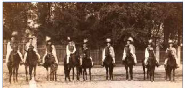
Pripravila: Mária Ducková-Adamcová

Druhá fotografia je z roku 1996, kedy firma pána Jozefa Hanzela zabezpečovala opravu a opieskovanie Lurdskej kaplnky . Na tretej fotografii je pamätná tabuľa, ktorú naša obec dala umiestniť do Lurdskej kaplnky v roku 1997 pri príležitosti obnovenia púti k Madone Žitného ostrova. Obecné zastupiteľstvo na pamätnú tabuľu schválilo nasledovný text: „ Na pamiatku všetkým, ktorí v dôsledku udalostí poslednej vojny stratili život alebo museli opustiť domov. Bože, ochraňuj nás od takýchto katastrof. “ Zároveň naša obec v roku 1997 na obnovenie púti pozvala vysídlených nemeckých občanov z našich pôvodných obcí Schildern, Mischdorf a Tartschendorf na návštevu svojho rodiska. Vysídlení občania a ich potomkovia, ktorí žijú v Esslingene v Nemecku, prijali naše pozvanie a prišli na trojdňovú návštevu plným autobusom.