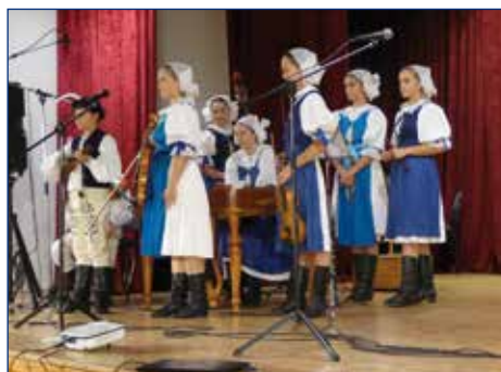
L'H DFS Vienok Bratislava