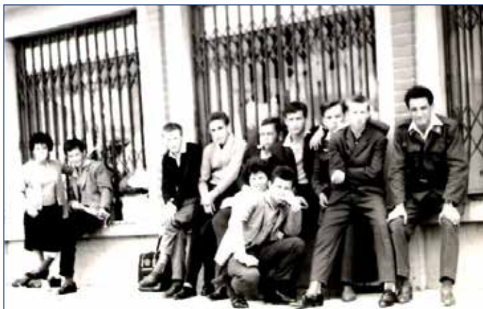
1961, na podokenici sa vysedávalo pri odchode na výlety a zájazdy