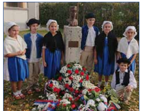
Omladina pri pamätníku