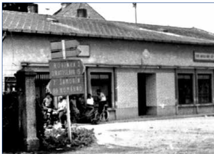
1960, pri budove sa stretávala mládež