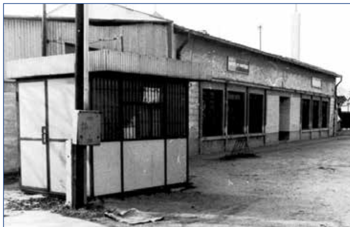
1985, v 80. rokoch bol pri predajni zmrzlínový stánok