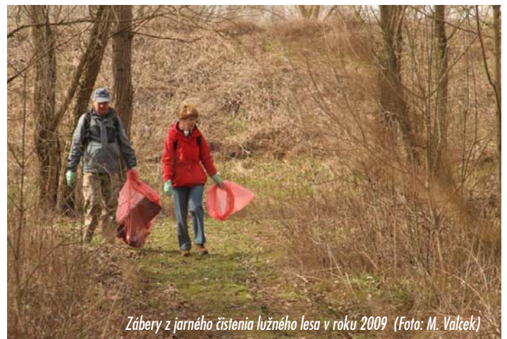
Zábery z jarného čistenia lužného lesa v roku 2009

Martin Valček, Bratislavské regionálne ochrannárske združenie – BROZ