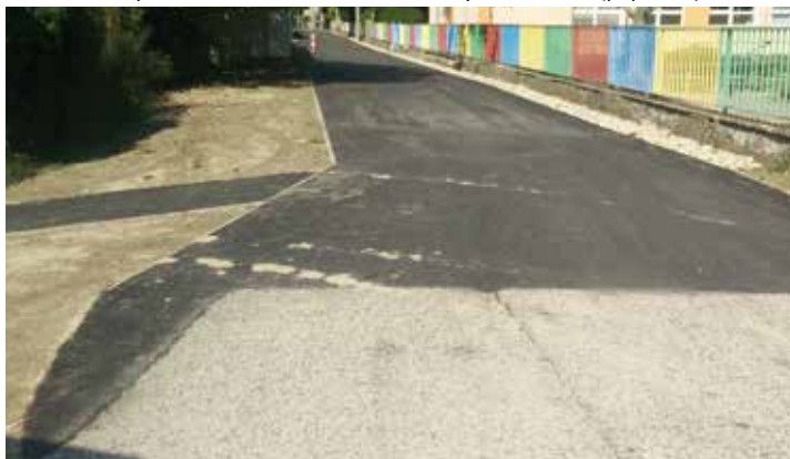
Oprava cesty popri jedálni ZŠ – Krížna ul. – 23.748 € pokračovanie na str. 9 dolu