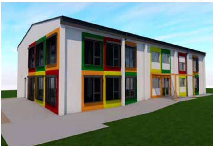
Vizualizácia štúdie novej MŠ v Novej Lipnici – Takto mohla vyzerat'