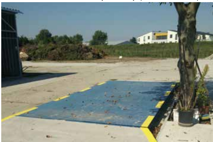
Dodanie a osadenie plošinovej váhy na zbernom dvore – 5.928 €