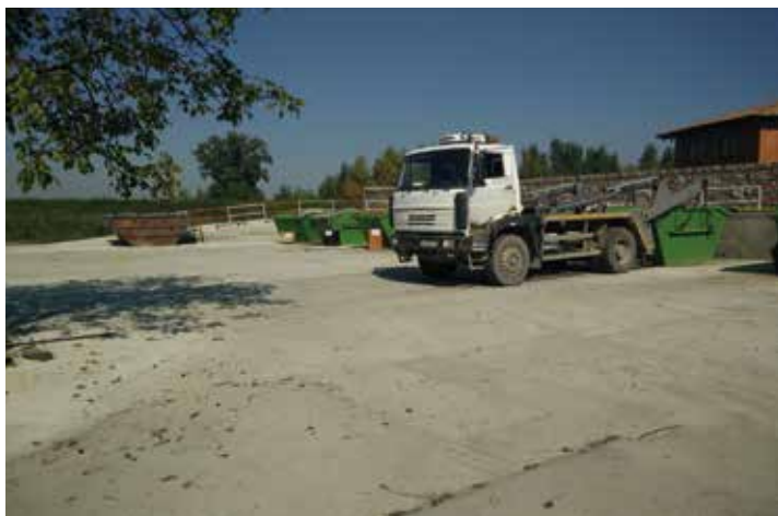
Výstavba spevnenej plochy pod kontajnermi a k rampe (zberný dvor) – 23.955 €