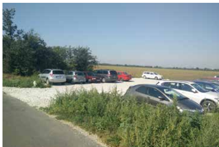
Oprava spevnenej plochy pri železničnej stanici Alžbetin dvor – 7.705 €