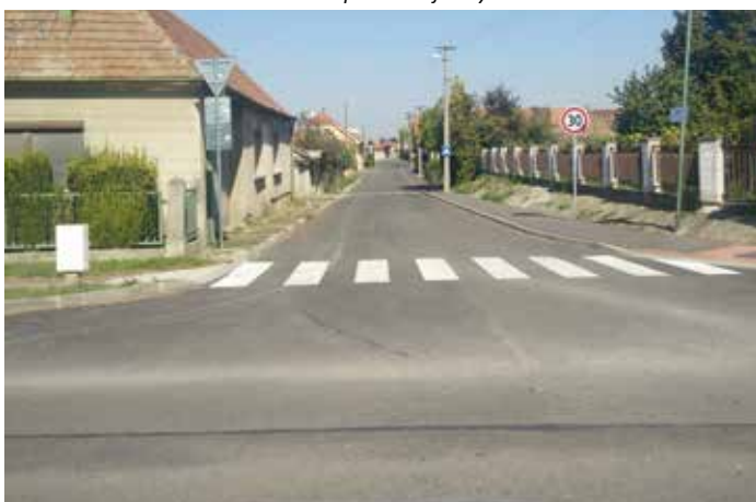
Oprava cesty, chodníka a odvodnenie - Krátka ul. – 52.316 €