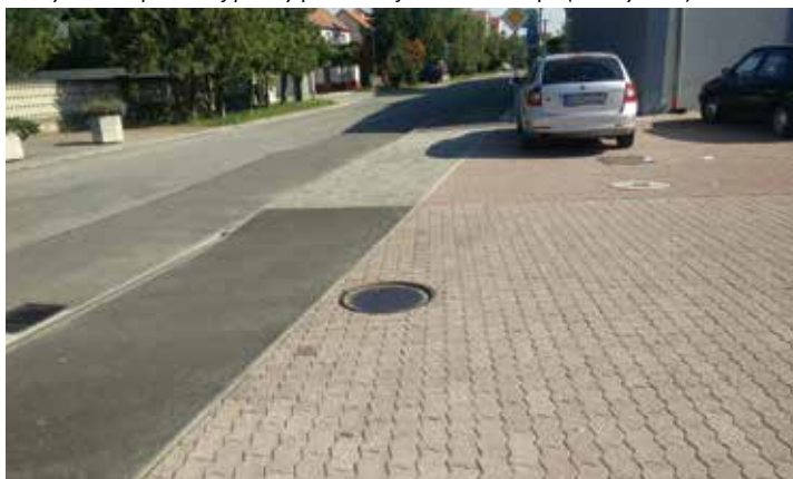
Oprava spevnenej plochy, chodníka a cesty pri MKS vrátane odvodnenia (Hlavná a Krajná ul.) – 42.262 €