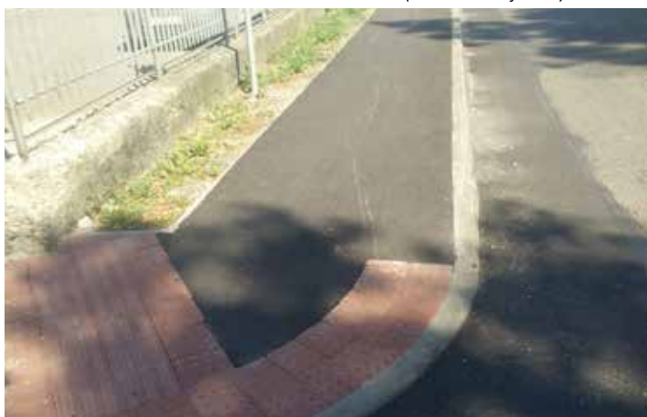
Oprava chodníka s odvodnením cesty – Hlavná ul. (popri KIA) – 5.422 €