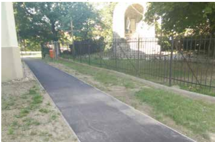
Oprava chodníka pri Lurdskej jaskyni – 2.753 €