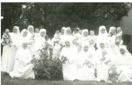
Obr. 2: Rok 1961: Sestry dominikánky s deťmi v areáli dojčenského ústavu

ho ľudského života. V ústave pracovali viacerí občania pôvodných obcí Nová Lipnica, Jánošíková a Nové Košariská (od r. 1974 spojených do obce Dunajská Lužná), ktorí tvorili so sestrami súdržnú komunitu.