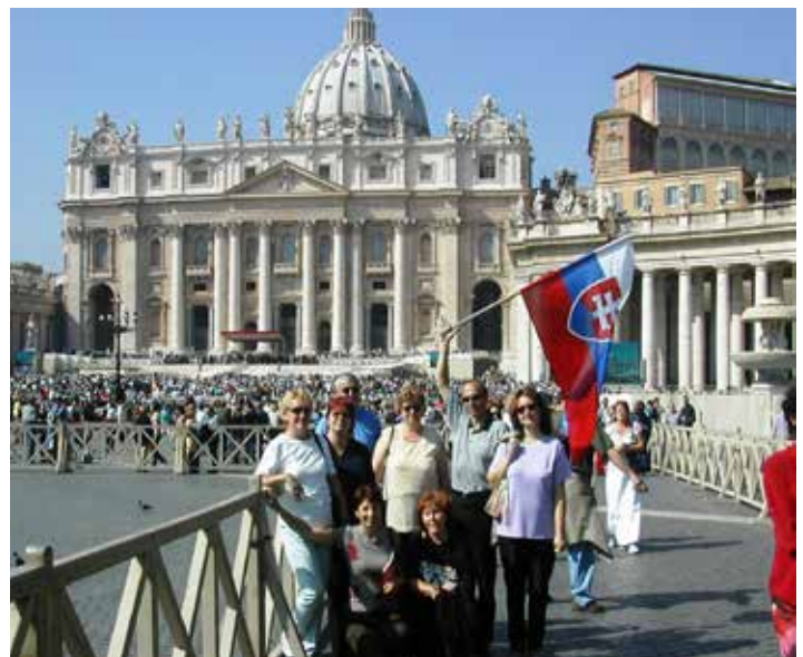
Skupinka z našej obce na námestí vo Vatikáne