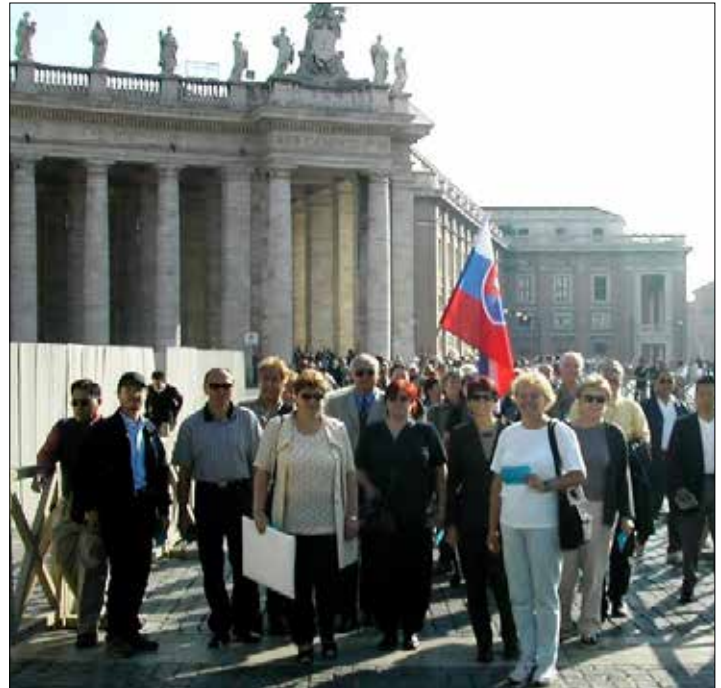
Čelo nášho sprievodu pred vstupom do Vatikánu