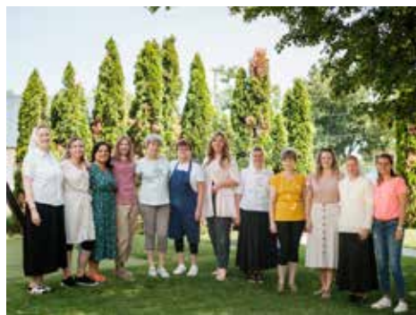
Obr. 10: Rok 2025: Kolektív z Cirkevnej materskej školy Madony Žitného ostrova pri príležitosti 10. výročia existencie materskej školy.

Madony Žitného ostrova. V r. 2024 sa začala budovať v priestoroch dnešného areálu Charitného domu a vo farskej záhrade nová Cirkevná základná škola Madony Žitného ostrova.