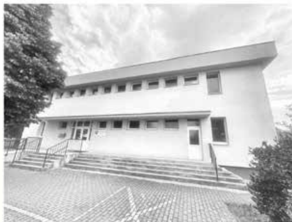
Rekonštrukcia materskej školy Nová Lipnica