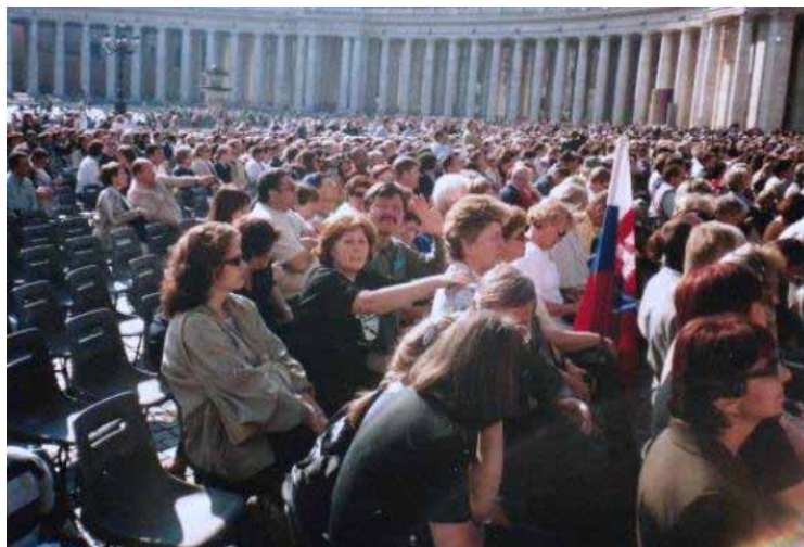
Námestie sa zaplňa pútnikmi