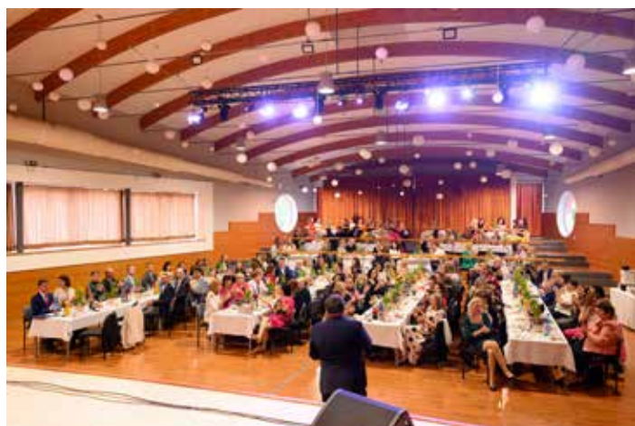
Deň učiteľov 2025

V piatok 25. apríla sme spolu s pedagogickými pracovníkmi školských zariadení našej obce oslávili Deň učiteľov. Ďakujeme všetkým, ktorí prijali pozvanie a užili si večer plný príjemných stretnutí a zaslúženej zábavy.