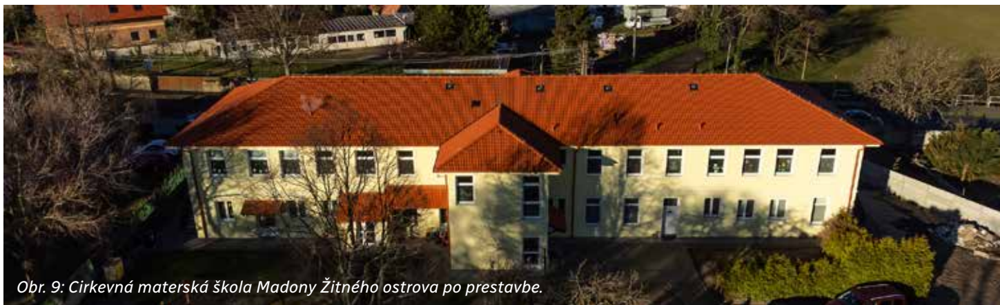
Obr. 9: Cirkevná materská škola Madony Žitného ostrova po prestavbe.

Obr. 1, 3, 5 archív Senior klubu; Obr. 2, 4, 6, 11, 12 archív Kongregácie sestier dominikánok bl. Imeldy na Slovensku; Obr. 7, 8 archív obce Dunajská Lužná; Obr. 9, 10 archív Cirkevnej materskej školy Madony Žitného ostrova.