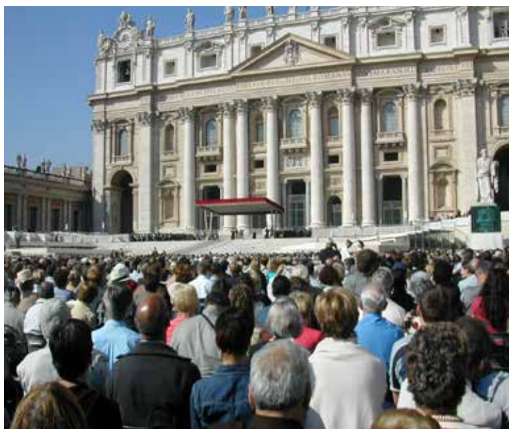
Pred Chrámom sv. Petra Sv.Otec, zástup kňazov a zástupcovia pútnikov