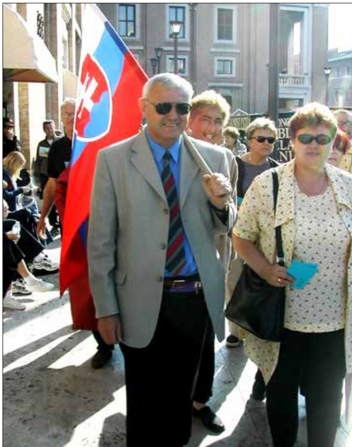
Spomienka na audienciu u Jána Pavla II.

Program zájazdu do Talianska s CK SATUR TRAVEL