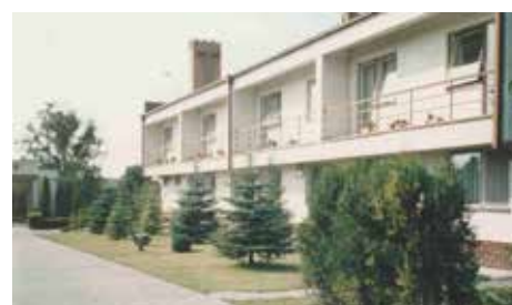
Obr. 5: Pohľad na Charitný dom v r. 1992

ho Charitného domu. Okrem sestier na dôchodku tu žili aj sestry, ktoré sa o ne starali a tiež sa podieľali v spolupráci s miestnymi kňazmi na širokom apoštoláte vo farnosti. Do konca r. 1983 bolo v Konvente bl. Imeldy spolu 32 sestier. V r. 1988 sa komunita rozrástla na 52 sestier.