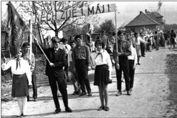
1967, žiaci nastupujú na oslavy 1. mája