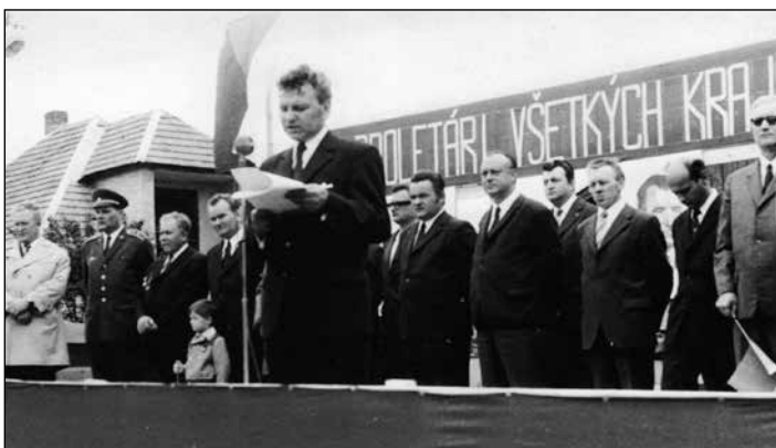
1974, predstavitelia obcí a podnikov na tribúne