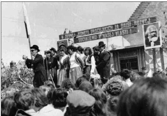
1967, kultúrny program popoludní 1. mája