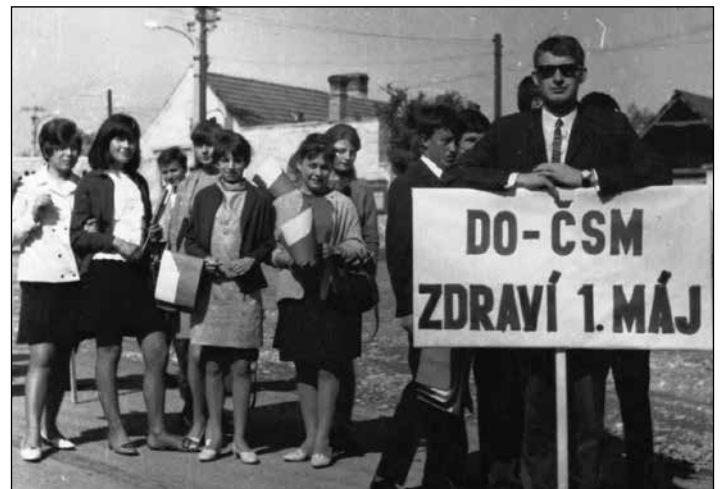
1968, mládež Novej Lipnice na námestí v Košariskách