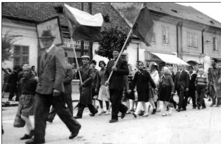
1957, občania a deti z Nových Košarísk v prvomájovom sprievode v Šamoríne

Do roku 1959 naše tri pôvodné obce Jánošíková, Nová Lipnica a Nové Košariská patrili do okresu Šamorín. Na prvomájové oslavy naši občania i deti chodievali do okresného mesta. Na odvoz do Šamorína miestni funkcionári zabezpečili nákladné auto, ktoré mládež a žiaci vyzdobili konármi a stuhami z krepového papiera. Účastníci si posadali na lavice umiestnené na nákladovej časti auta. V Šamoríne sa naši občania zapojili do sprievodu Hlavnou ulicou, pred budovou ONV (okresným národným výborom) zamávali zástavkami predstaviteľom okresu, ktorí boli na tribúne pred ONV (v súčasnosti budova polikliniky v Šamoríne). Na futbalovom ihrisku si vypočuli slávnostný prejav. Kto mal záujem, zostal popoludní na kultúrnom programe a veselici v letnom amfiteátri v Pomlé.