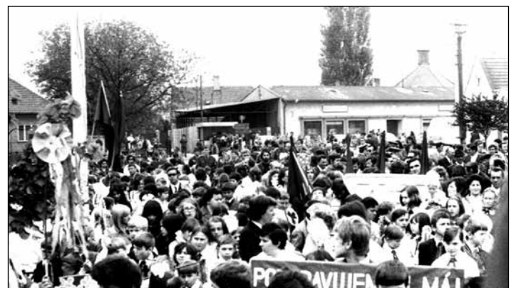
1974, účastníci prvomájovej oslavy na námestí