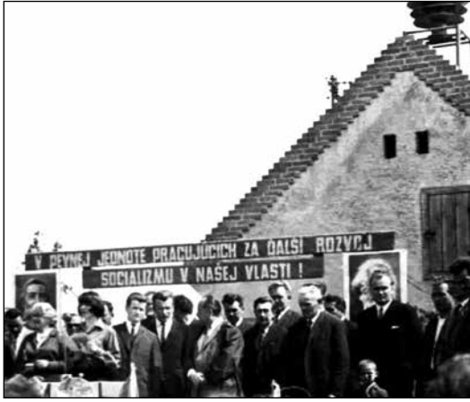
1967, predstavitelia troch obcí na tribúne na námestí v Nových Košariskách