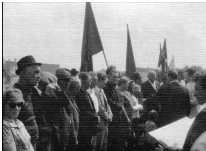
1959, Košarišťania na ihrisku v Šamoríne pri prvomájovom prejave