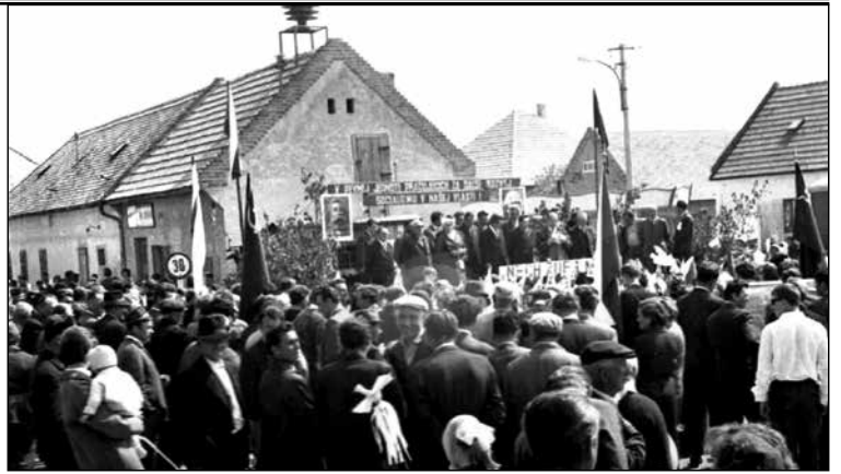
1967, bohatá účasť občanov na oslave 1. mája