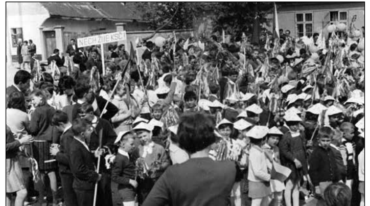
1967, najmenší žiaci s papierovými klobúčikmi