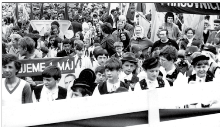
1974, žiaci tanečného krúžku pred prvomájovou tribúnou