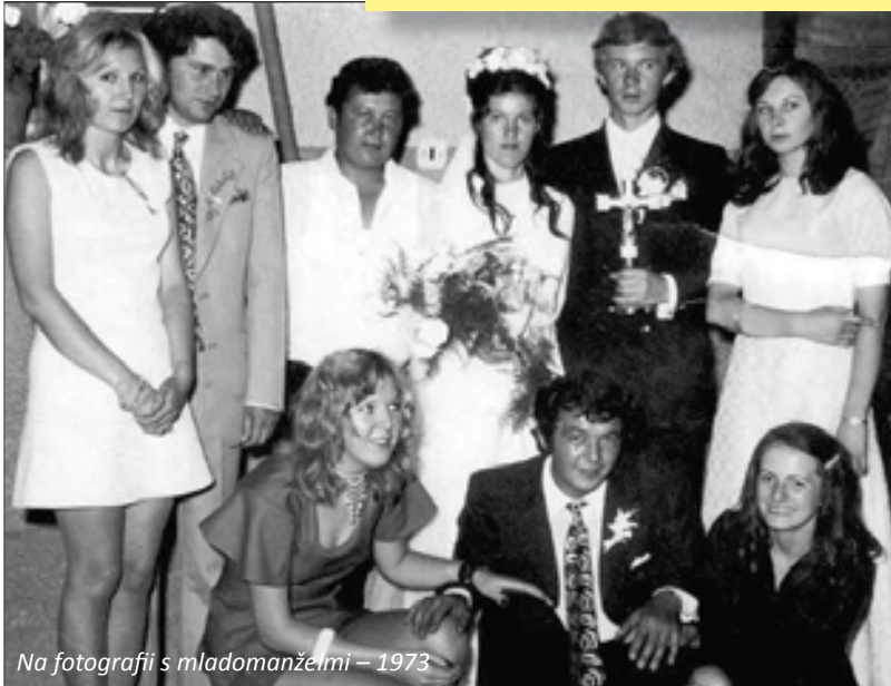
Na fotografii s mladomanželmi – 1973