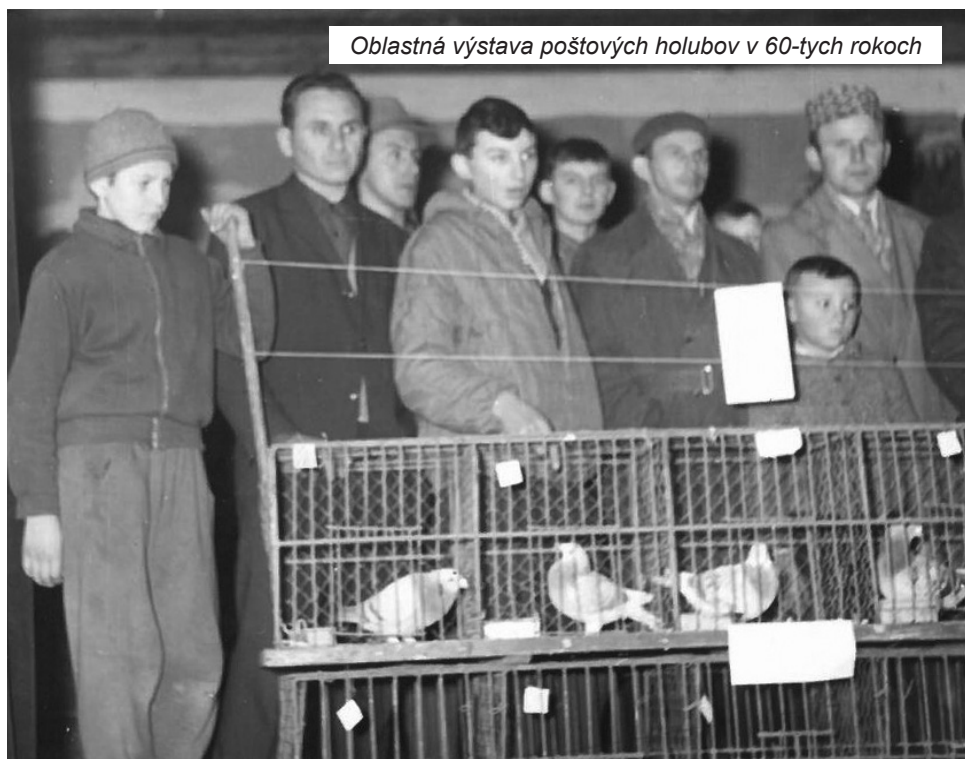
Oblastná výstava poštových holubov v 60-tych rokoch