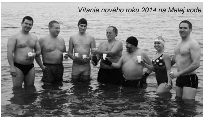
Vítanie nového roku 2014 na Malej vode

predseda klubu Ľadových medveďov Dunajská Lužná