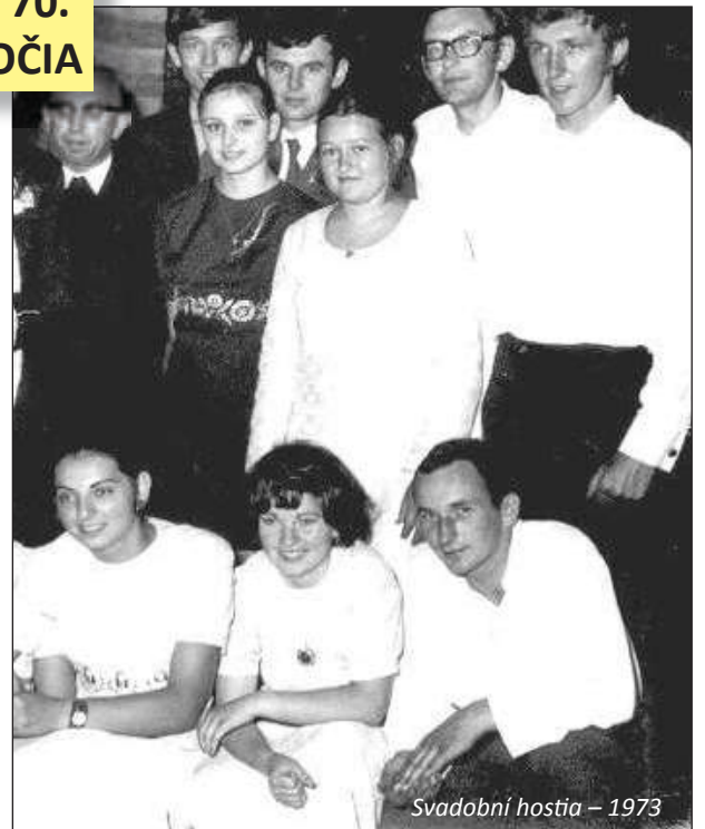
Svadobní hostia – 1973