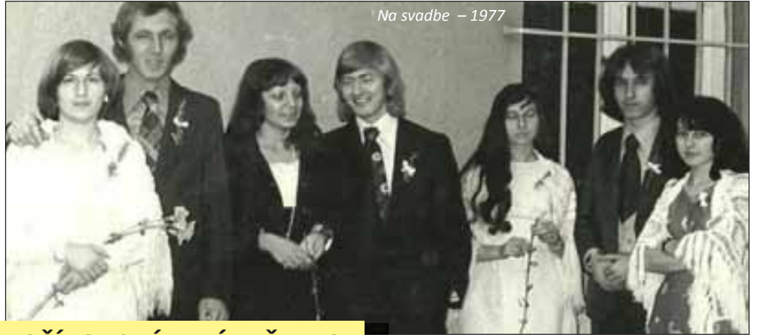
Na svadbe – 1977