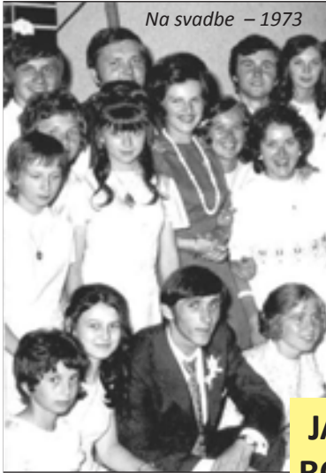
Na svadbe – 1973

Noviny pre každého občana a priateľa našej obce • Nepredajné • Október 2014 • Ročník 4 • ISSN 1338-4945