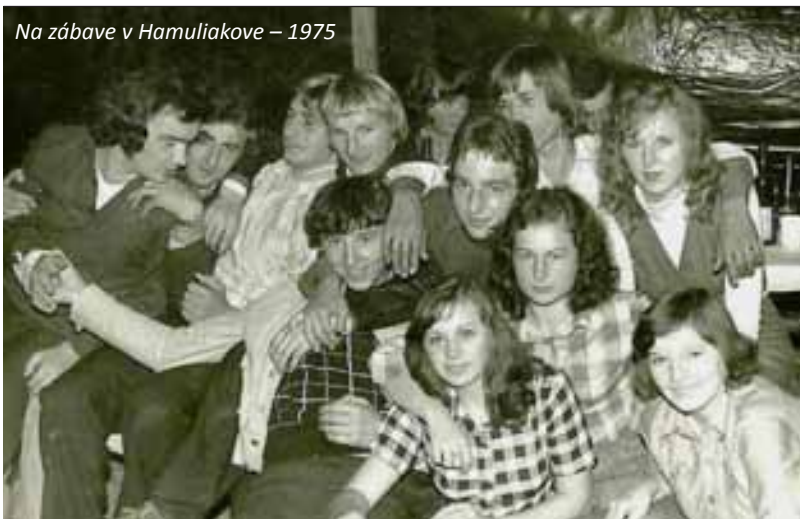
Na zábave v Hamuliakove – 1975