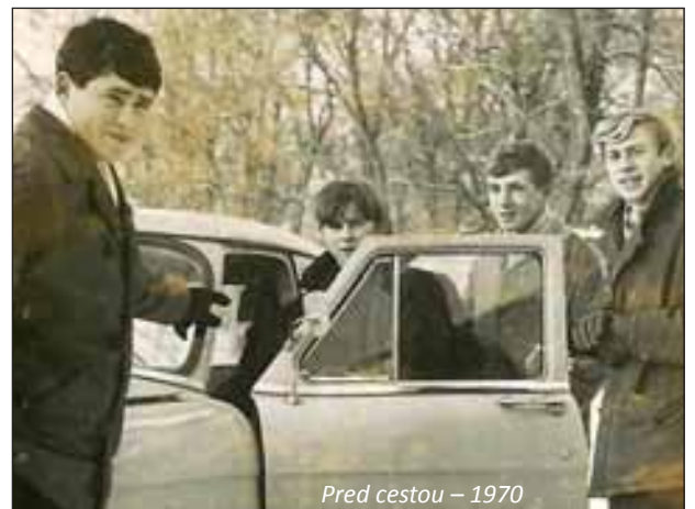
Pred cestou – 1970