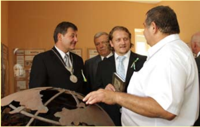
Deň obce – otvorenie Kováčskej galérie, foto: Michaela Bednárová