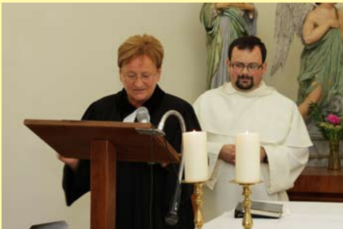
Deň obce – ekumenická bohoslužba v kaplnke sv. Martina