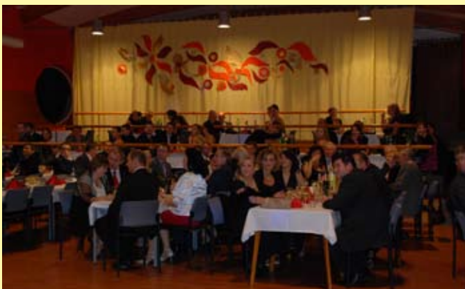
13. ročník Školského plesu, foto: Martina Oltusová