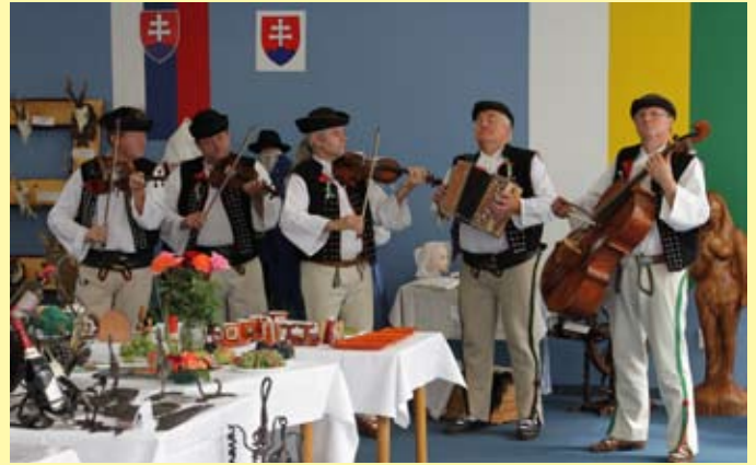
Deň obce – Ťažká muzika z Terchovej