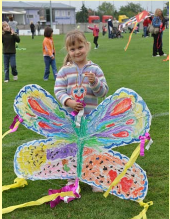
Púšťanie šarkanov