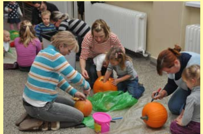
Vyrezávanie tekvic