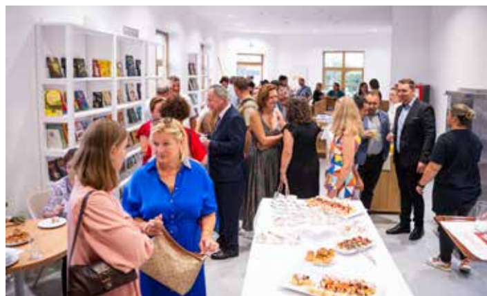
Pozvaní hostia pri otvorení knižnice

Toto bol skvelý rozbeh pred nasledujúcim dňom, ktorý mal byť vyvrcholením osláv.