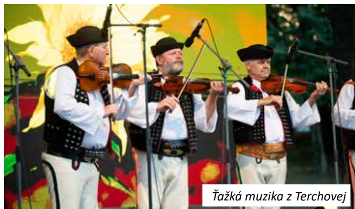
Ťažká muzika z Terchovej