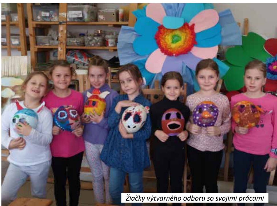
Žiačky výtvarného odboru so svojimi prácami

Orgány našej obce oceňujú prácu ZUŠ pre obec a na oslave Dňa učiteľov v obci