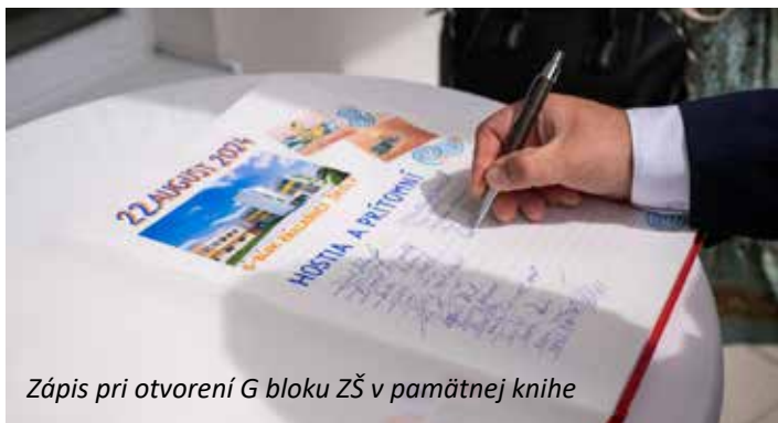
Zápis pri otvorení G bloku ZŠ v pamätnej knihe