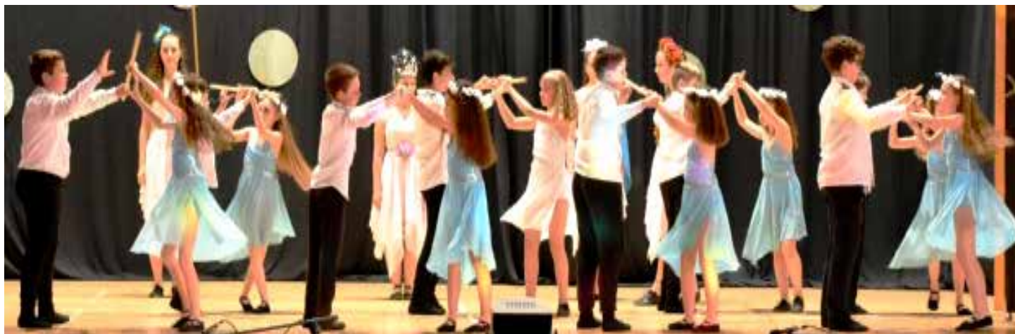
2020, žiaci tanečného odboru na vystúpení v miestnom kultúrnom stredisku

ZUŠ sa od otvorenia zapájala do rôznych podujatí v obci a súťaží na Slovenku i v zahraničí. Najmä žiaci výtvarného odboru dosiahli výrazné výsledky získaním popredných umiestnení výtvarných prác na medzinárodných súťažiach v Lidiciach v Českej republike, v Budapešti, Juhoafrickej republike, Egypte, Poľsku. Úspešne sa umiestňovali i žiaci hudobného odboru. Na celoslovenskej súťaži Nitrianska lutna bola veľmi úspešná trieda dychových nástrojov. I v súťaži Slávik Slovenska v okresnom kole v Senci získali 2. a 3. miesto žiaci hudobného odboru. Tanečníci v spolupráci s detským folklórnym súborom Prvosienka sa zúčastňujú prehliadok folklórnych súborov a každoročne v našej obci pripravujú tanečné vystúpenie na Deň obce.