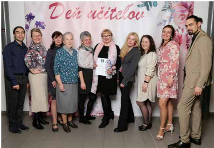
2023, pedagogický kolektív ZUŠ na oslave Dňa učiteľov, archív ZUŠ