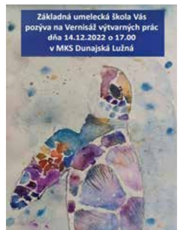
Výtvarné práce žiakov prezentované aj ako pozvanie na podujatia organizované školou