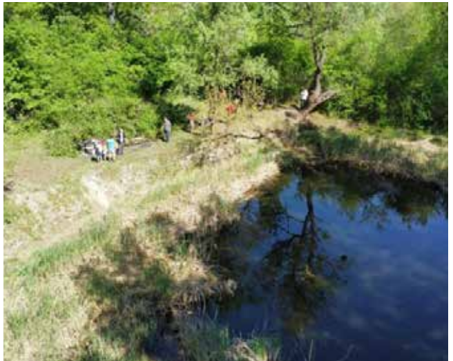
Jazierko a okolie počas revitalizácie