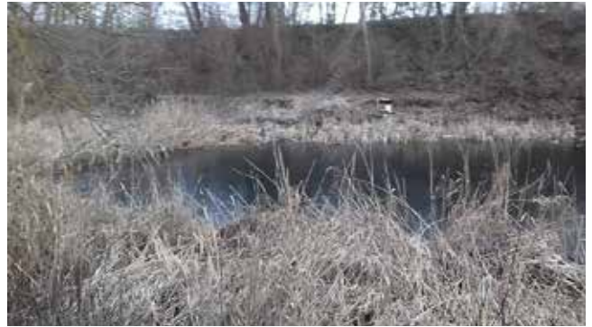
Jazierko pred revitalizáciou