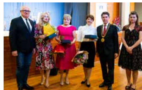
Oceneným blahoželali starosta i poslanci