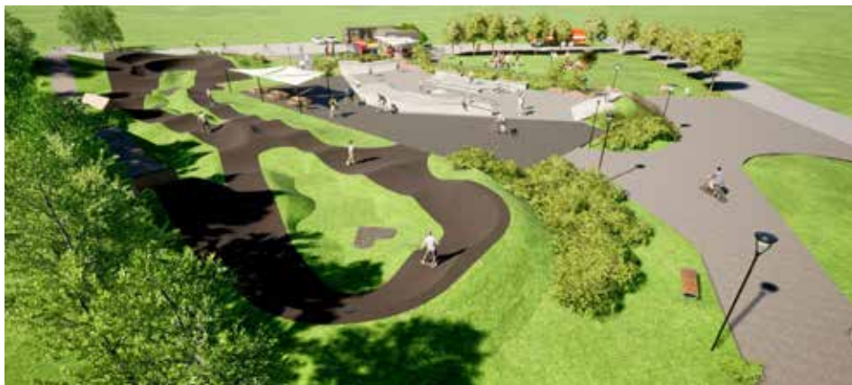
Vizualizácia pumptrackovej dráhy