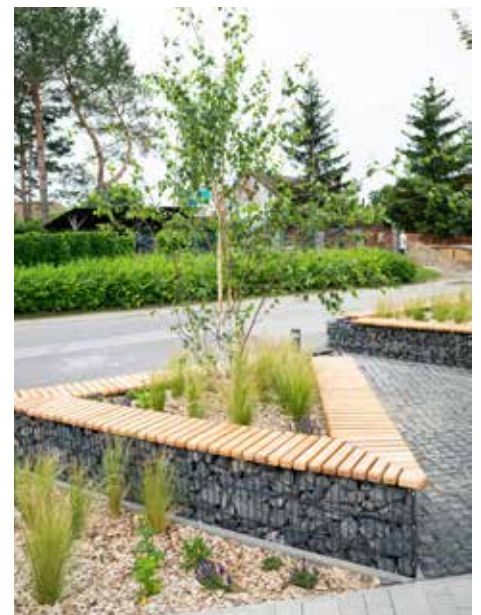
Autobusová zastávka Nové Košariská a okolie