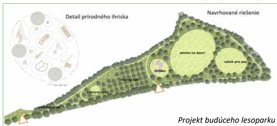
Projekt budúceho lesoparku