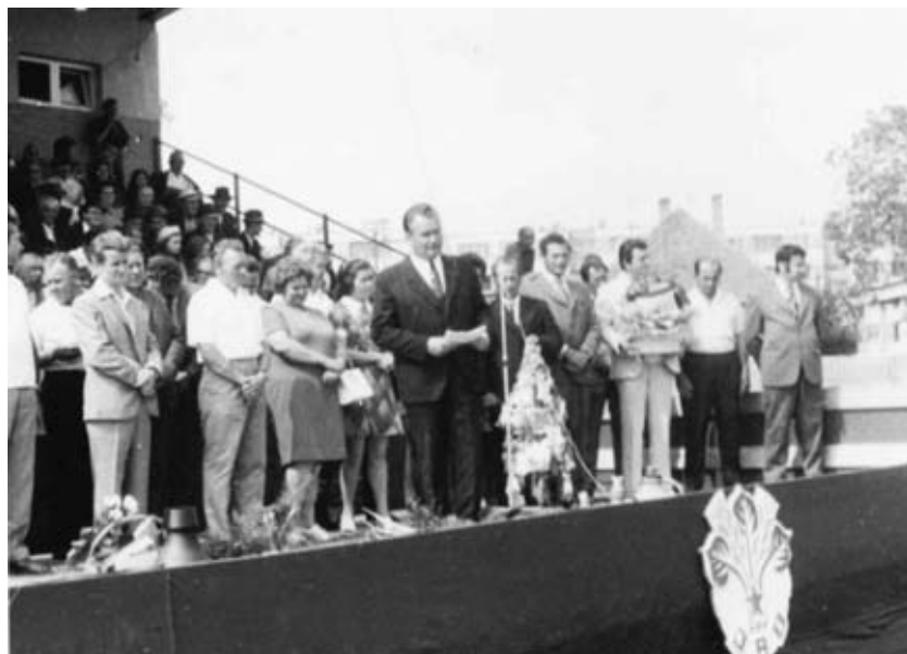
Na futbalovom štadióne sa uskutočňovali všetky dôležité udalosti obce, oslavy 1. mája, dožinky, oslavy dňa detí a pod. Na fotografii z roku 1975 je záber z dožinkových slávností JRD Úsvit pri Dunaji