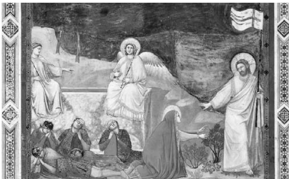
Giotto di Bondone, freska Vzkriesenie Krista, kaplna Scrovegni, Padova

Často sa môžeme stretnúť s ľuďmi, ktorí majú ťažkosti veriť vo vzkriesenie. Nie sú to zlí ani zlomyseľní ľudia. Do krízy viery sa môže dostať aj ten, kto sa snaží praktizovať svoju vieru. Počúvame: „Modlím sa, chodím do kostola, párkrát do roka k sviatostiam i Bibliu čítam...“ Za čias Pána Ježiša farizeji verili vo vzkriesenie, ale sáducej vo vzkriesenie neverili. A Ježiš sáducej vysvetľuje vzkriesenie i vtedy, keď zaútočia vymyslenou udalosťou o žene,