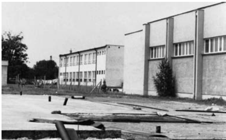
Po dobudovaní telocvične a školskej jedálne s družinou, v školskom areáli za začalo i s výstavbou ihriska