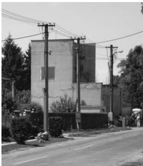
Budova trafostanice, ktorá bola postavená v 70-tych rokoch minulého storočia