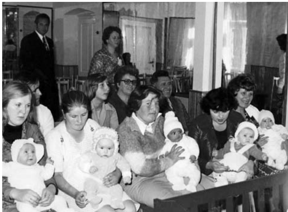
Slávnostné uvítanie detí do života v roku 1977 v obradnej sieni starého MNV v časti Jánošíková, v pozadí predseda MNV a pani matrikárka