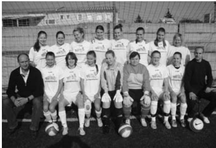
Družstvo žien OFK v sezóne 2013/2014

V zimnom období sa družstvo žien zúčastnilo aj dvoch medzinárodných halových turnajov. V decembri obsadili na „Christmas cup-e“ v Olomouci 7. miesto z 10 účastníkov. Zmerali sme si sily s takými tímami ako Sparta Praha, Baník Ostrava či Sigma Olomouc. V januári obsadili ženy na turnaji v Rakúsku pekné 2. miesto z desiatich účastníkov, keď vo finále nestačili domácim hráčkam z Bruck an der Leitha. V súčasnosti sa družstvo žien pripravuje na jarnú časť sezóny 2013/2014. K družstvu sa od januára pripojili dve hráčky, ktoré v minulosti stabilne hrávali za OFK a ďalšie dve kvalitné posily sú v štádiu vybavovania.