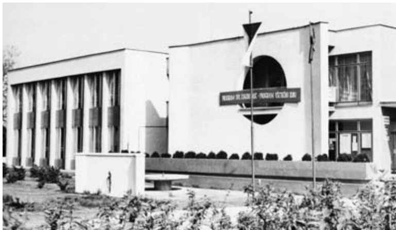
Nová budova MNV, ktorá bola dostavaná v roku 1979