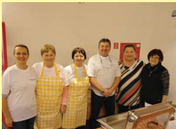
zohratý tím dobrovoľníkov