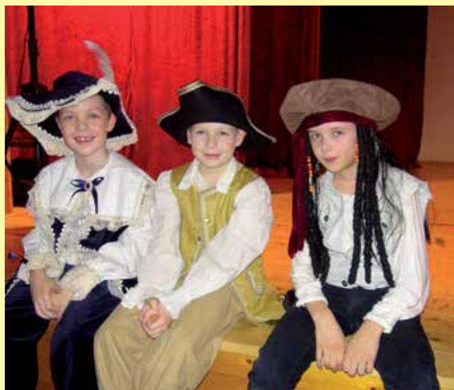
Akční štvrtáci v dobových maskách