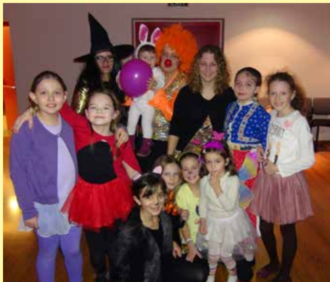
Dievčatá – mladšie či staršie – vo fašiangových maskách