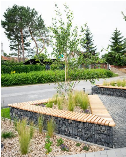
Referenčná ukážka gabionového vyvýšeného záhonu realizovaného v predpolí knižnice v Dunajskej Lužnej. Sedenie sibírsky smrekovec.